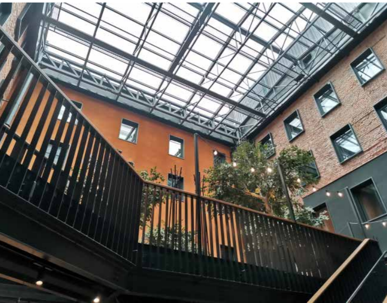
Lasikatto antaa atriumpihaan valoa.

Matkamme jatkui bussilla kohti Helsingin yöpymispaikkaa Hotel Mestaria, joka oli myös loppupäivän