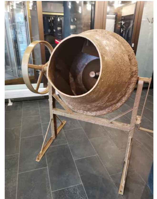
Betonimylly hotellin eteisessä.