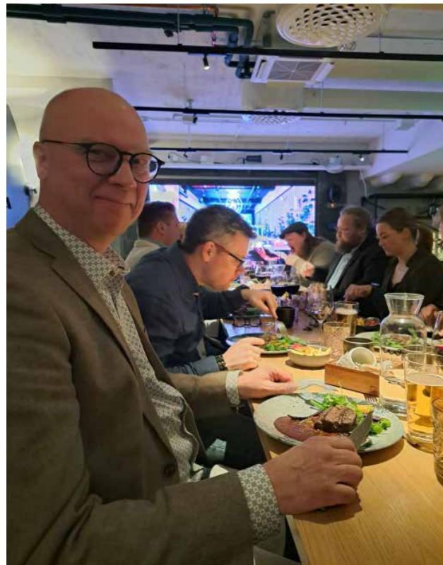
Illallinen maistui kaikille.