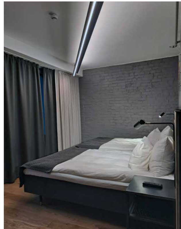
Ratakiskosta tehty huoneeseen upea valaisin.