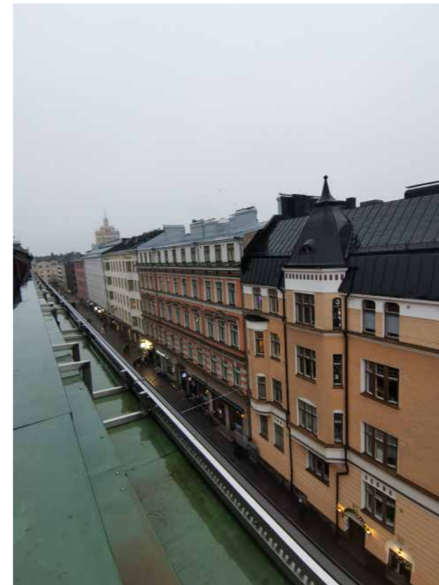
Ylimmän kerroksen sviitistä on kahteen ilmansuuntaan upean historialliset rakennusnäkyvät.